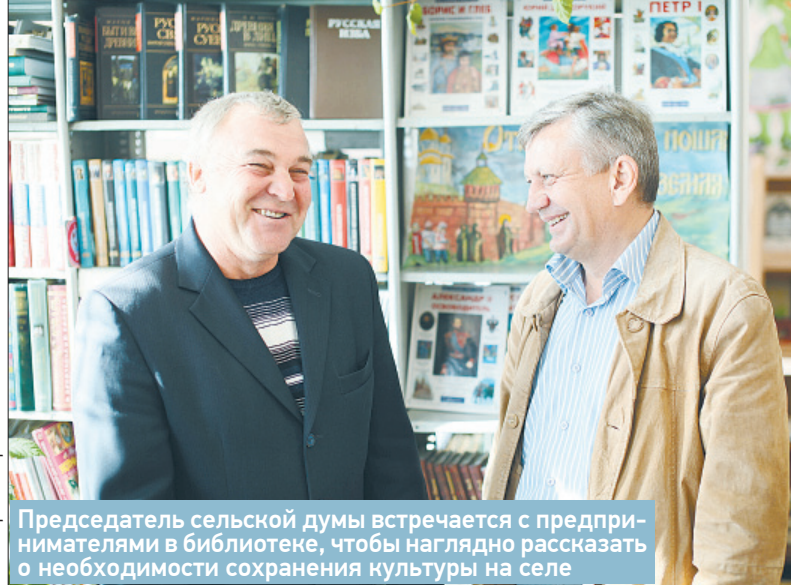
Председатель сельской думы встречается с предпринимателями в библиотеке, чтобы наглядно рассказать о необходимости сохранения культуры на селе