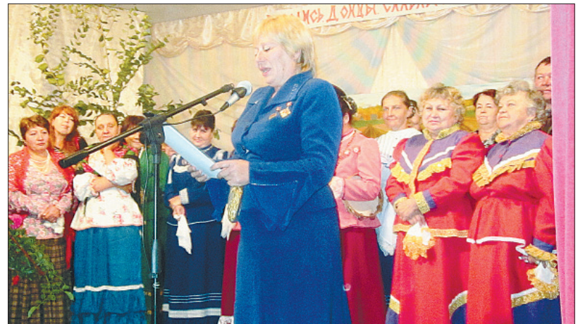
Межтосовский фестиваль приурочен к Покрову Пресвятой Богородицы

В мероприятии приняли участие также главы сельских поселений Клетского и Серафимовичского рай-