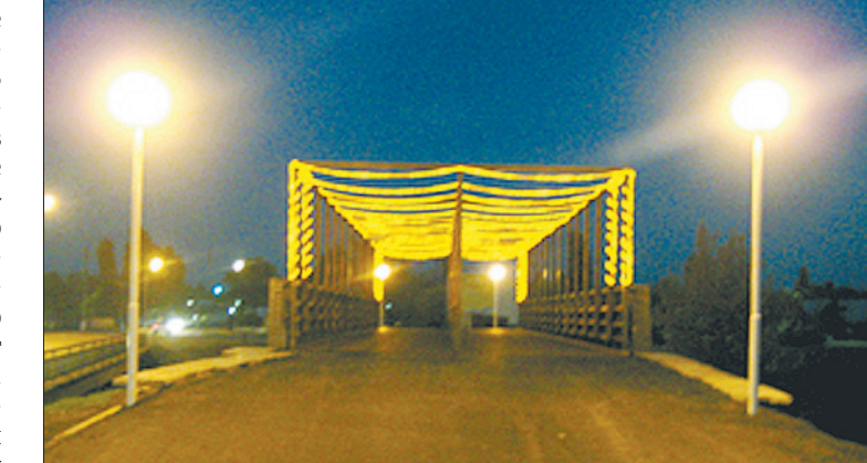
Трудно поверить, что «Французскому мосту» исполнилось 100 лет